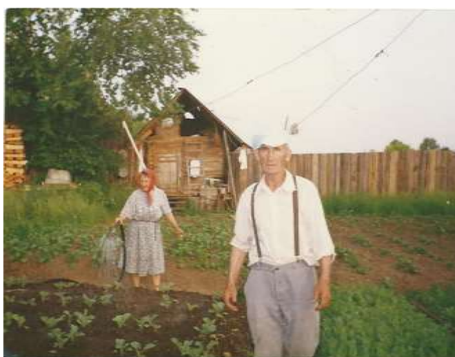
Своё хозяйство - работа в радость!