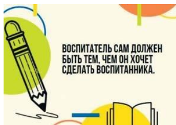
Рис. П2.2. Пример карточки с цитатой