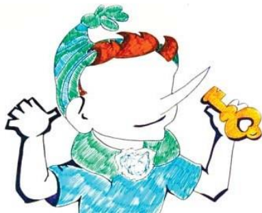
Рис. П2.3. Пример «Буратино»