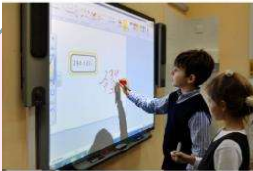
Изучение нового материала