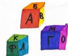
Cubes with letters