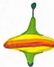
Волчок Spinning top